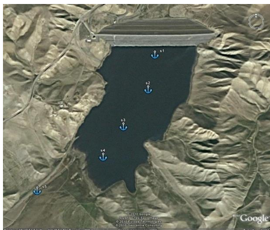
شکل شماره ۱. دریاچه ارسباران و محل ایستگاه‌های نمونه‌برداری